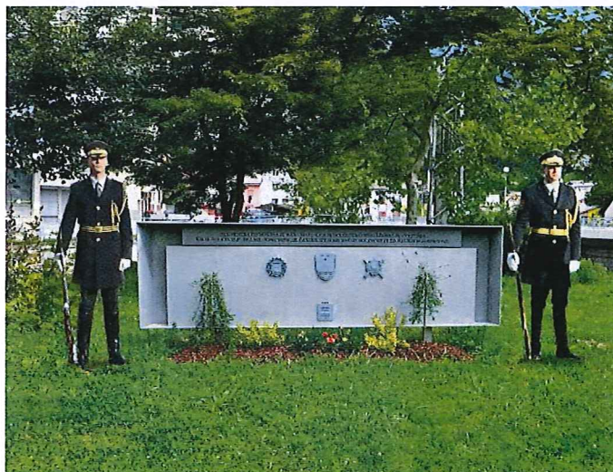
Spominsko obeležje dogodkom, ki so se v osamosvojitveni vojni za Slovenijo odvijali na območju nekdanje občine Idrija ter ljudem, ki so dali svoj prispevek k vojaškemu zavarovanju samostojnosti naše države.

Slovenska trobojnica je na drogu, prepleskanim v barve slovenske trobojnice, ponosno plapolala vrsto let. V Območnem združenju veteranov vojne za Slovenijo Idrija Cerknjo, pa je že dalj časa zorela ideja, da bi v Idriji postavili spominsko obeležje posvečeno dogodkom, ki so se na območju tedanje občine odvijali v obdobju osamosvojitvene vojne za Slovenijo in ljudem, ki so v teh dogodkih sodelovali. Po ogledu številnih lokacij je na pobudo arhitekta Silvija Jereba prevladala zamisel, da spominsko obeležje sodi na zelenico pred Osnovno šolo, kjer je že stal drog z zastavo in je bila posajena lipa.