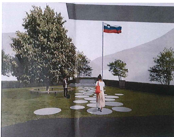
Vizualizacija končne ureditve Spominskega parka osamosvojitve Slovenije v Idriji.

spominskega obeležja ter hortikulturno ureditev območja, v prihodnjih letih nadaljevala ter, da bi spominski park čimprej dobil svojo končno podobo.