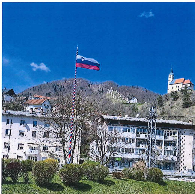
Obnovljen drog z državno zastavo v Spominskem parku osamosvojitve Slovenije v Idriji.

V letu 2021 je bila izdelana krožna klop, premera petih metrov v kovinsko leseni izvedbi, ki je bila koncem leta postavljena okoli spominske lipi. S to klopjo se izpostavlja zgodovinski pomen tega drevesa. Istočasno pa klop Idrijčanom in turistom nudi tudi mesto za druženje in počitek.