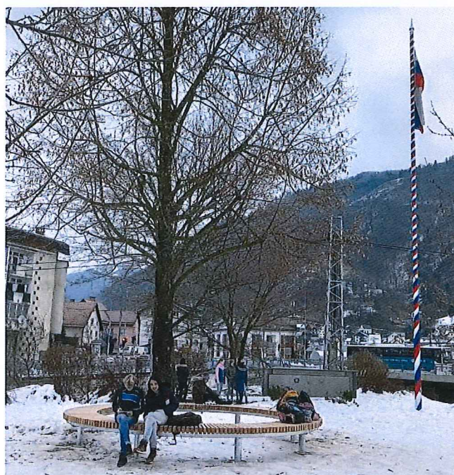
Krožna klop ob spominski lipi v Spominskem parku osamosvojitve Slovenije v Idriji.

V letu 2021 je bila izdelana krožna klop, premera petih metrov v kovinsko leseni izvedbi, ki je bila koncem leta postavljena okoli spominske lipi. S to klopjo se izpostavlja zgodovinski pomen tega drevesa. Istočasno pa klop Idrijčanom in turistom nudi tudi mesto za druženje in počitek.